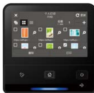
个人打印的缩略图显示