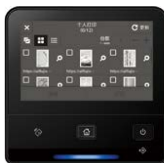
个人打印的缩略图显示

使用个人打印功能时，您可以查看面板上显示的缩略图来轻松选择和删除相应文件。操作方便，可以节省时间并减少浪费。