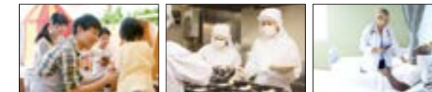
儿童看护中心/学校 酒店 (食品和服务) 行业 医院