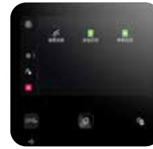
5英寸彩色触控面板