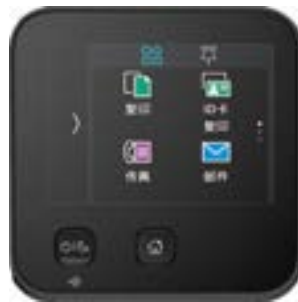
2.8英寸彩色触控面板